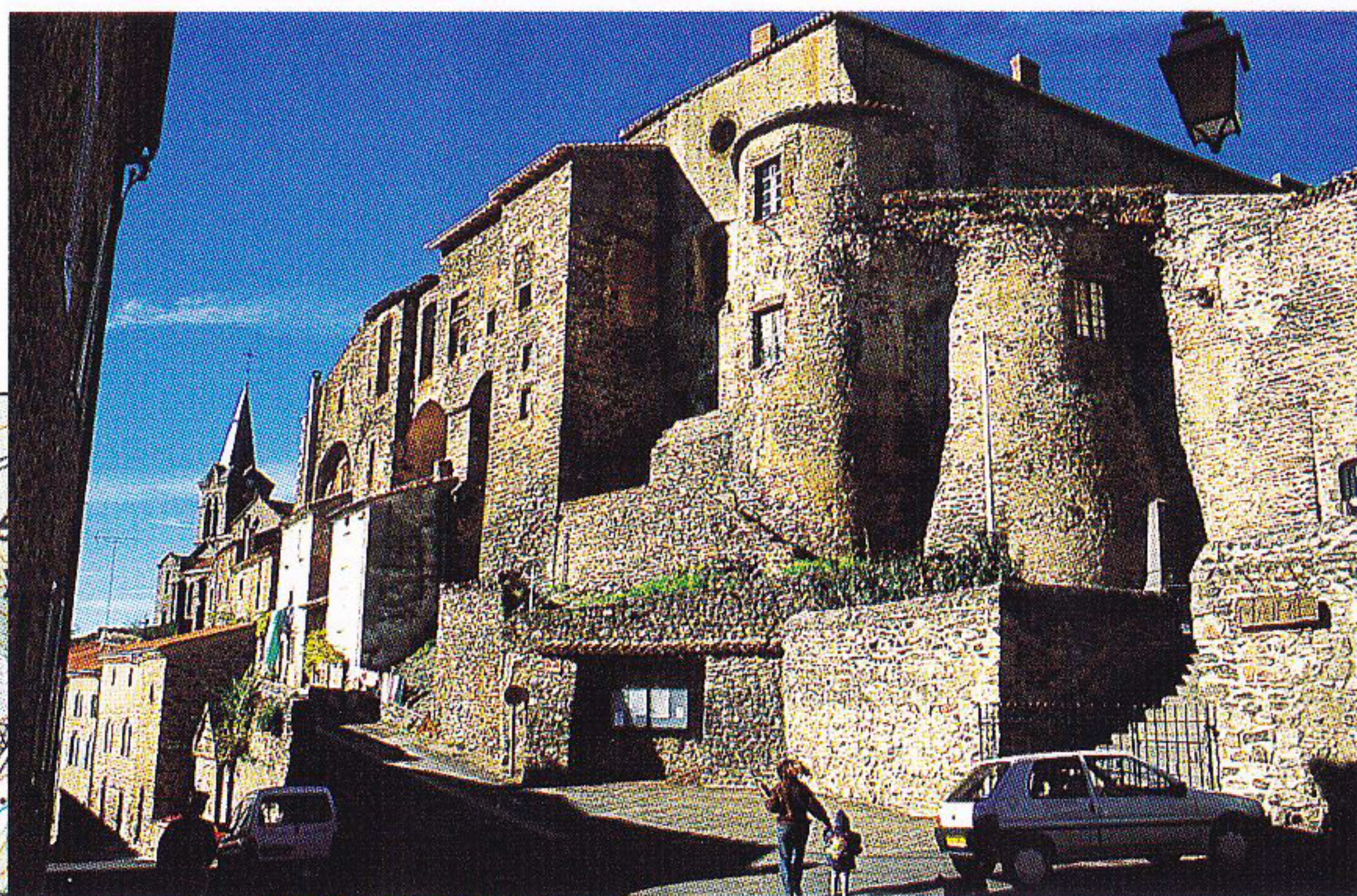
Lamothe et son imposant château médiéval présenté p. 32-33.

réserve du Précaillé ). Rejoindre la D 16 et la suivre à gauche sur 300 m. 4 Bifurquer sur le chemin de droite. Au croisement, continuer à gauche. Suivre un ru, puis virer à droite pour le traverser. Longer la réserve du Précaillé (site floristique) . 5 À l'intersection, continuer à droite en contournant la réserve. Ignorer les chemins qui partent dans les champs. 6 Bifurquer à droite ( vue sur Lamothe ). Emprunter le deuxième chemin à gauche et marcher le long de l'Allier jusqu'à Cougeac ( ancien pont et ruines de la chapelle Saint-Laurent,